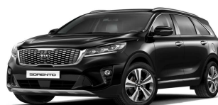
Aurora Black Pearl (ABP)