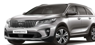
Silky Silver (4SS)