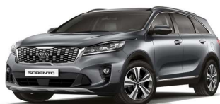
Steel Grey (KLG)