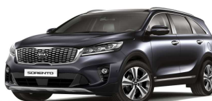
Platinum Graphite (ABT)