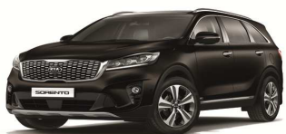
Rich Espresso (DN9)