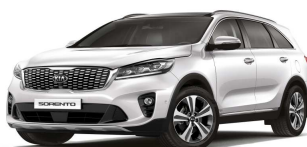
Snow White Pearl (SWP)