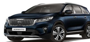
Gravity Blue (B4U)